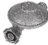
Joint de détendeur